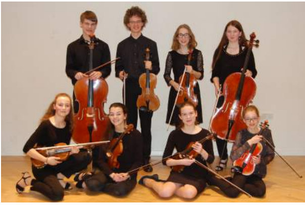
Unser erfolgreiches Oktett