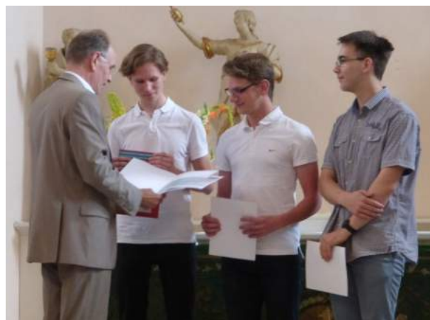
1. Platz beim Landeswettbewerb