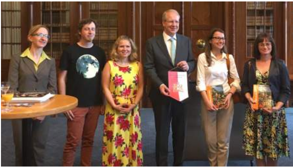
Empfang beim Oberbürgermeister Schostok