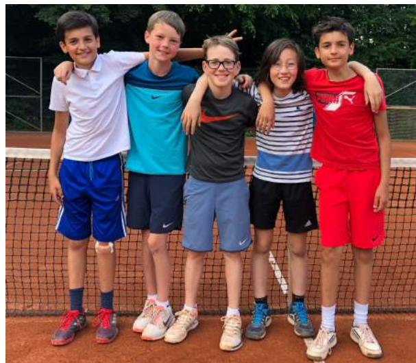
„Jugend trainiert für Olympia“ – unsere Jungen