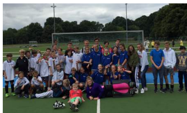
Große Erfolge auf dem Hockeyplatz