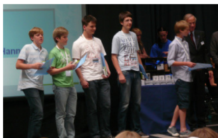
Die „Brainiacs“ bei der Preisverleihung am 24.6.09