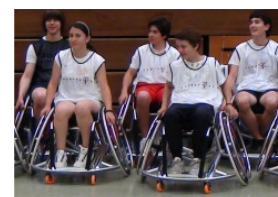
Rollstuhlbasketball am 7.9.2010