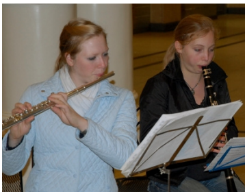
KWR-Schüler beim Musizieren für krebserkrankte Kinder

Seit vielen Jahren spielen Schülerinnen und Schüler des KWR in der Adventszeit Weihnachtslieder im hannoverschen Bahnhof und sammeln dabei Spenden für die Kinderkrebstation der MHH.