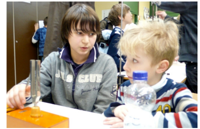
Tag der offenen Tür 2010