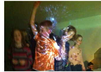
SV-Party für die Jahrgänge 5 und 6