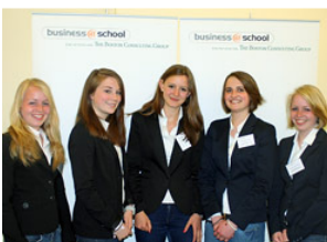
Das KWR-Team "NEW GmbH"