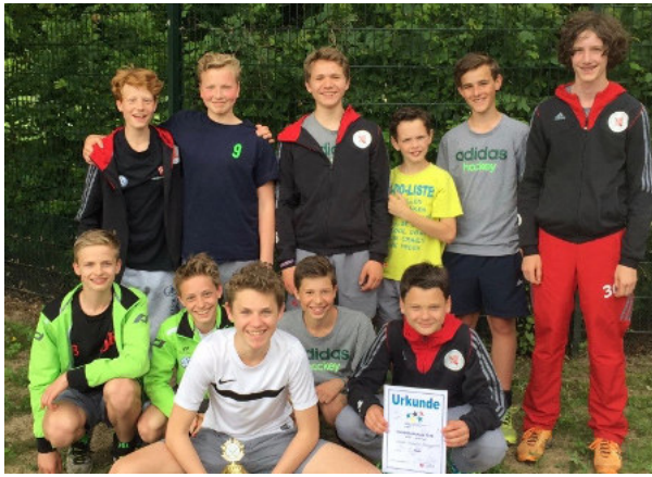
„Wir fahren nach Berlin!!!“