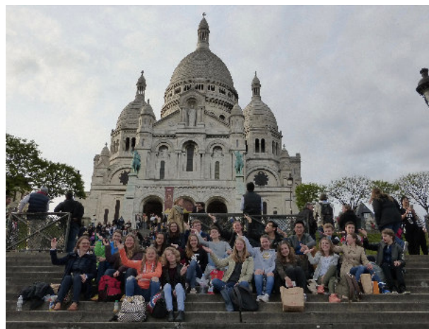
Studienfahrt nach Paris im Mai 2016