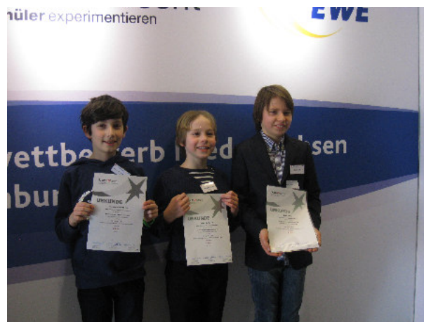
KWR ist „Jugend Forscht“-Schule 2016“