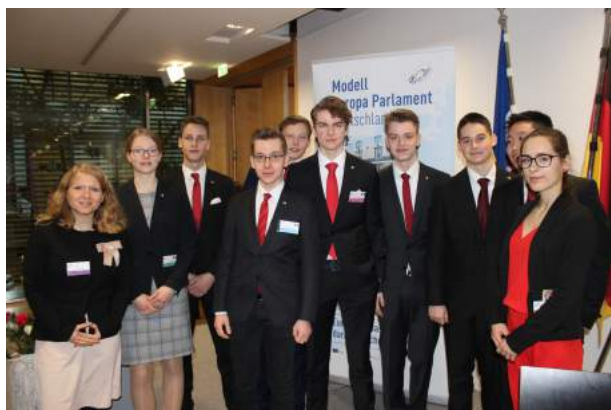
Das zwanzigste Modell Europaparlament

Hannover: Zwei Monate vor dem Brexit und vier Monate vor den Wahlen zum Europaparlament wollen sich Schüler*innen des KWR Hannover zum Thema „Europa“ zu Wort melden. Nach einem hart umkämpften Vorentscheid konnten sich acht Schüler*innen des zehnten Jahrgangs für das diesjährige Modell Europaparlament qualifizieren. Dazu machten sie sich in der letzten Januarwoche auf nach Berlin, wo sie gemeinsam mit 150 Gleichgesinnten aus ganz Deutschland Antworten aus jugendlicher Sicht auf die aktuellen europäischen Probleme geben wollten.