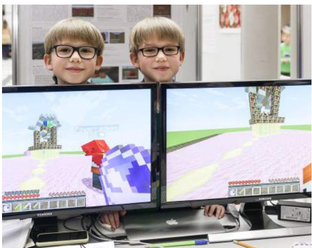
Lernen mit Minecraft