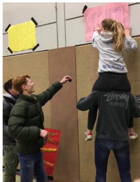
Die SV bei den Vorbereitungen