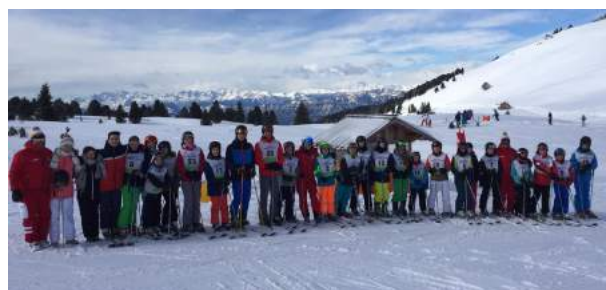
Viel Schnee am Jochgrimm