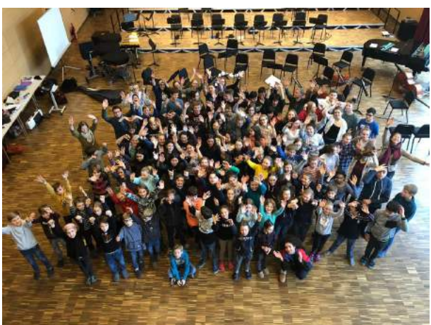
Musizieren für das KWR-Konzert