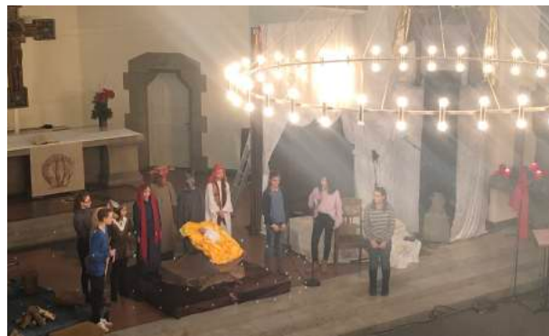
In der Markuskirche

Weitere Informationen und kurzfristige Änderungen entnehmen Sie bitte www.kwr-hannover.de/