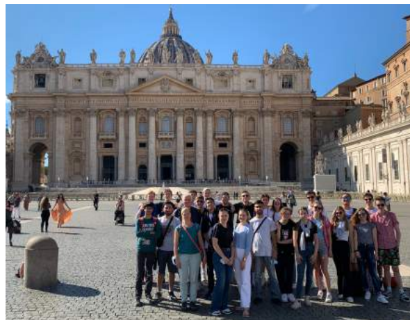
Vor dem Petersdom