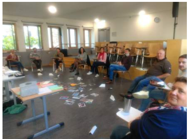
Gemeinsames Erarbeiten von Bewältigungsstrategien