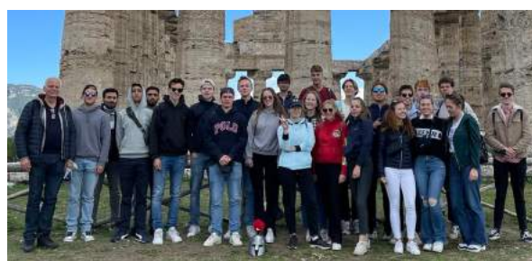
Vor einem Tempel in Paestum