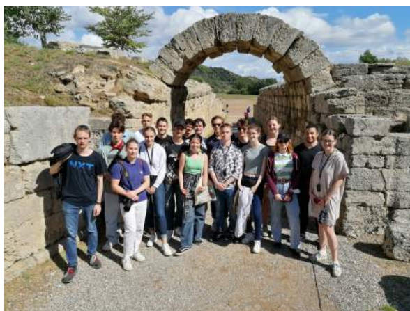
Durch diesen Gang schritten über 1000 Jahre lang die olympischen Athleten