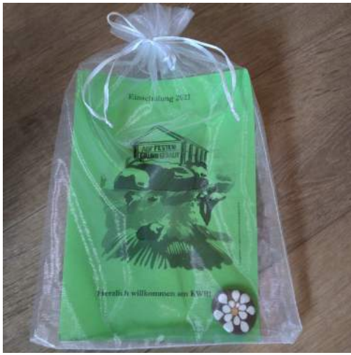
Die Neuen sind da!