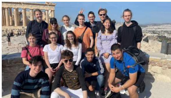
Einst Mittelpunkt der antiken Welt: die Akropolis