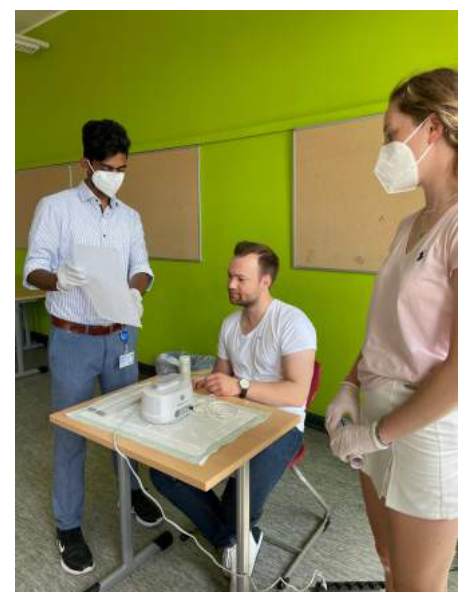
Abnahme von Sputum in der Villa