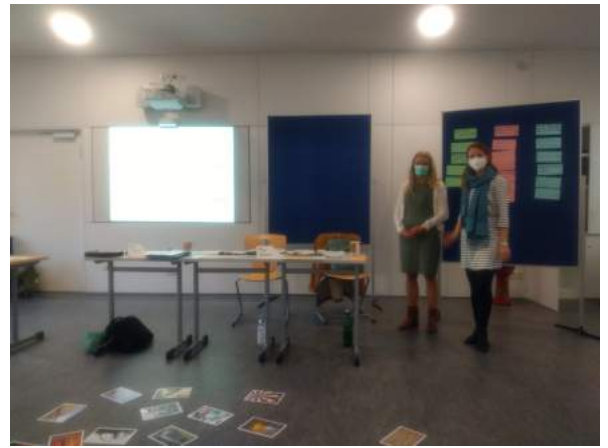
Krisensituationen zusammen meistern

Weitere Informationen und kurzfristige Änderungen entnehmen Sie bitte www.kwr-hannover.de/