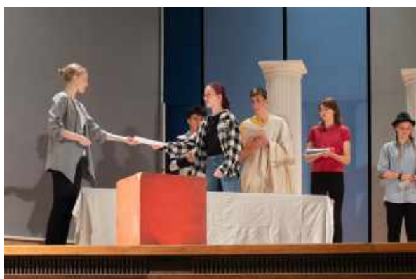
Übergabe der Urkunde