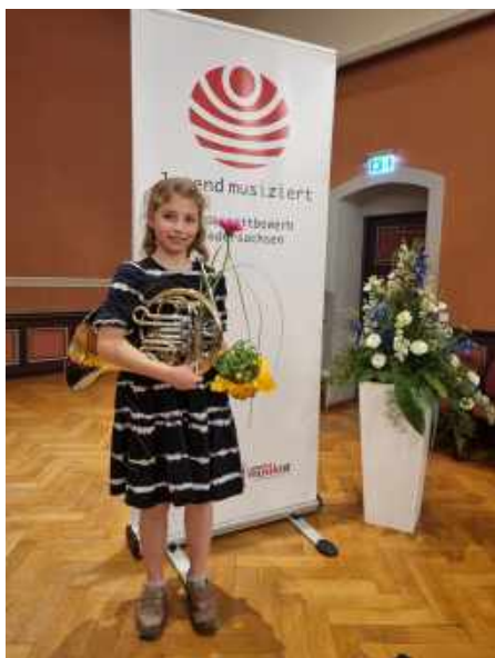
Erfolgreiche Teilnahme am Wettbewerb