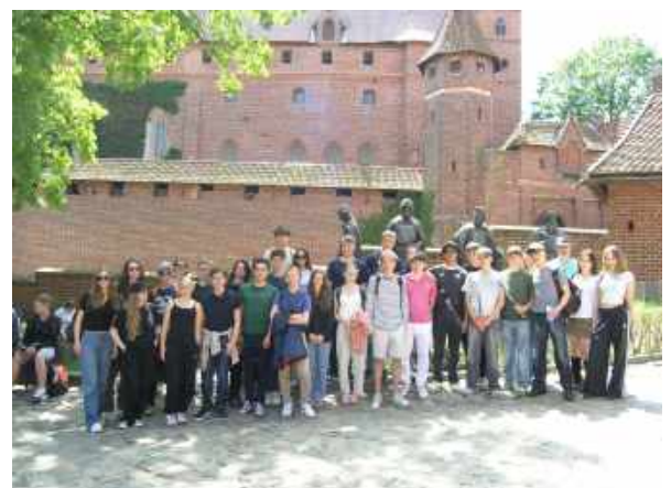
Austausch mit polnischen SchülerInnen