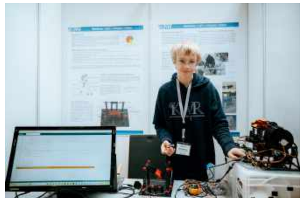
B-KWR: Batterie-Kraft Wirksam Retten