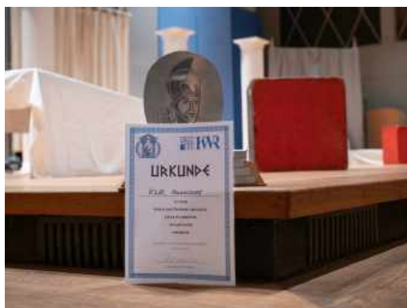
Urkunde und Pokal