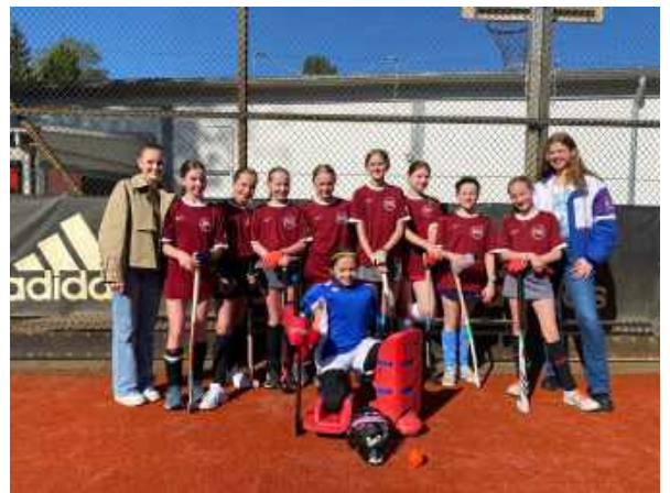
Auf nach Berlin!