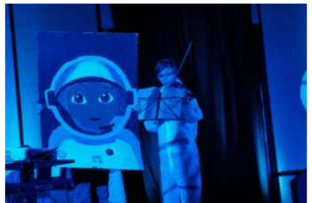
Zwischen den Galaxien