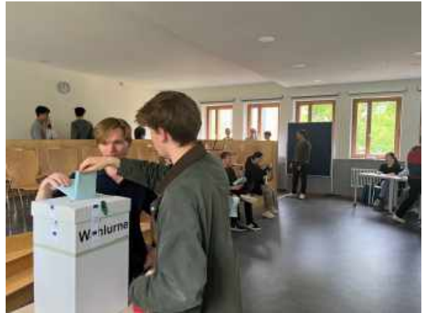
Simulation der Europawahl